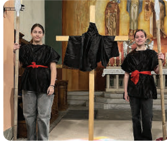
Soldaten beim Kreuz