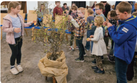
Kinder beim Osterstrauch schmücken

Die Osternachtsfeier begann um 21.00 Uhr in der Dunkelheit mit dem Osterfeuer. Von dort aus wurde die Osterkerze entzündet und in feierlichem Einzug in die noch dunkle Kirche getragen. Das Osterlob, erfüllte den Raum mit Hoffnung. Mit dem Gloria des Kirchenchors wurde es plötzlich hell: Glocken und Schellen erklangen und verkündeten die Auferstehung. Im Anschluss an den Gottesdienst wurde beim gemeinsamen Eiertütchen in der Kirche die Freude geteilt – denn gerade im Miteinander strahlt das Osterlicht besonders hell. Ein herzliches Dankeschön an alle, die den Weg von der Dunkelheit ins Licht eindrucksvoll mitgestaltet haben.