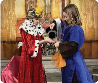
Pilatus wäscht seine Hände in Unschuld