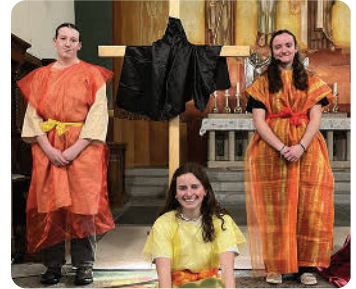
Frauen beim Kreuz